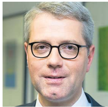
Norbert Röttgen, CDU

■ Was sie treibt: Die „Botschafterin der Ökologie 2011“ und Solar-Befürworterin will die schnelle Energiewende.