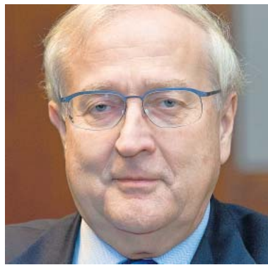
Rainer Brüderle, FDP

■ Was ihn treibt: Der pure Machtwille. Er weiß, dass der Atomausstieg derzeit bei den Wählern angesagt ist.